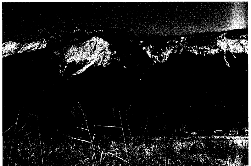
Abb. 61: Im Frühjahr und im Herbst lassen sich die unterschiedlichen Lebensräume – Fels und einzelne Waldgesellschaften – gut gegeneinander abgrenzen. Blick von Oberschütt Richtung Norden.

Neben dem dominanten Berg-Laserkraut stellen Fieder-Zwenke ( Brachypodium rupestre ) und Erd-Segge die vorherrschenden Gräser bzw. Sauergräser in der Versaumungsgesellschaft dar. Trocken- und wärme-liebende Saumpflanzen, unter ihnen das Echte Salomonssiegel ( Polygonatum odoratum ), der Blut-Storchschnabel ( Geranium sanguineum ), die Aufrechte Waldrebe ( Clematis recta ), das Maiglöckchen ( Convallaria majalis ), die Gras-Schwertlilie ( Iris graminea ) und die Pannonische Kratzdistel ( Cirsium pannonicum ), fühlen sich in der sonnenexponierten Lage wohl.