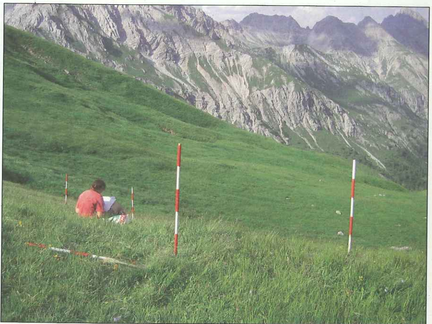
Abb. 3: Erstellen einer Referenzfläche im Untersuchungsgebiet Riebenkofel.

flächen bei Wiederholungsaufnahmen erleichtern (Abb 2, 3).