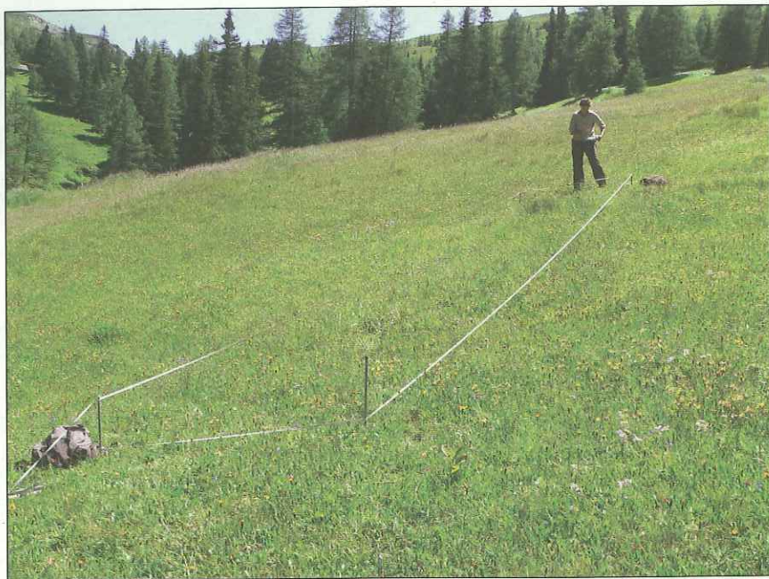
Abb. 4: Pflanzenaufnahme auf einer der Referenzflächen (2 x 10 m) im Gontal.

(ca. 2 x 50 m), erfolgte die Zählung der Individuen (Blühsprosse) so genannter Leitarten. Als solche „Leitarten“ wurden Arten ausgewählt, die als charakteristisch für extensiv genutzte artenreiche Bergmäher gelten können und bei Aufgabe oder Intensivierung der Nutzung verschwinden oder in deutlich geringerer Zahl auftreten wie z.B. Arnica montana (Arnika), Dianthus superbus (Pracht-Nelke), Ligusticum mutellina (Alpen-Mutterwurz), Pedicularis elongata (Langähren-Läusekraut), Hypochoeris uniflora (Einblütiges Ferkelkraut, Abb. 5), Nigritella nigra (Schwarzes Kohlröserl, Abb. 6), Gymnadenia conopsea (Mücken-Händelwurz), Traunsteinera globosa (Kugelorchis).