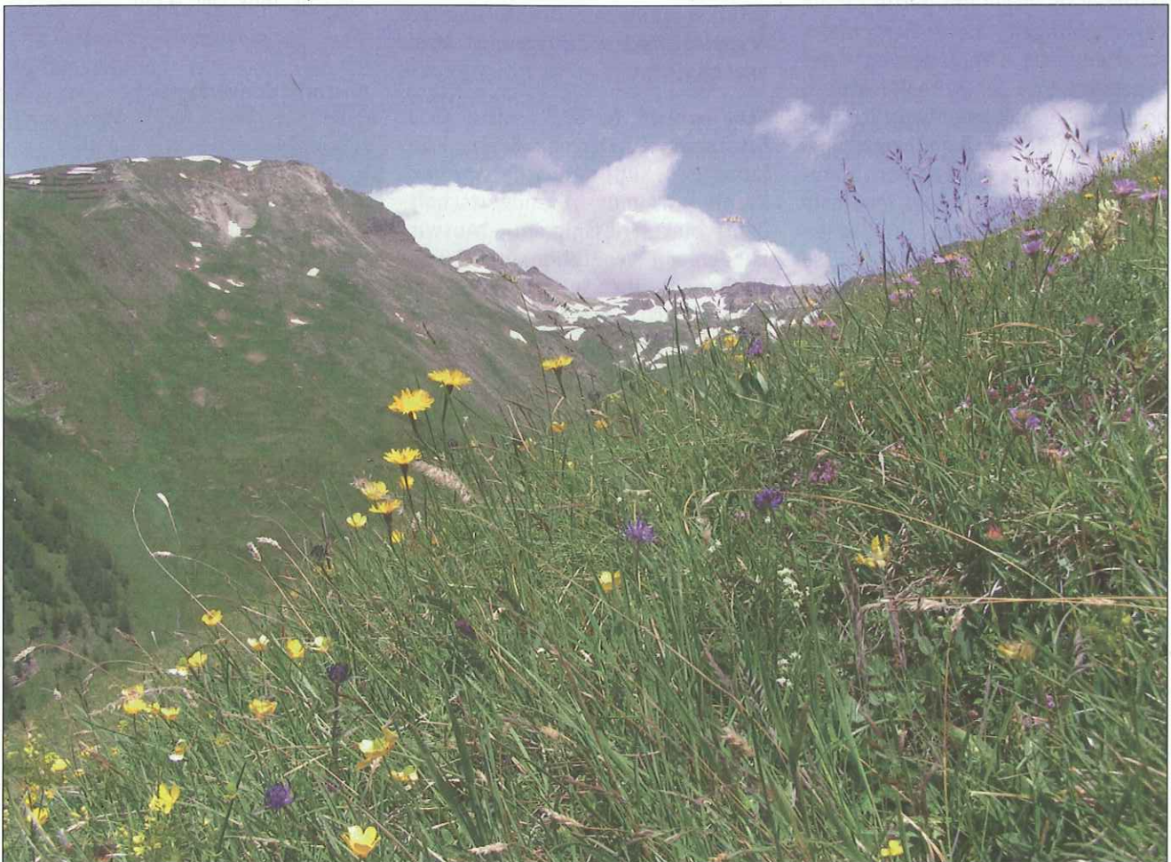
Abb. 1: Artenreiche, halbschürige Bergmahdfläche im Untersuchungsgebiet Fleißtal, Heiligenblut.

Dabei wurde nicht nur der aktuelle Status quo der Bergmähder erhoben, sondern auch die Basis für ein langfristiges Monitoring gelegt. Damit können Veränderungen in der Vegetation