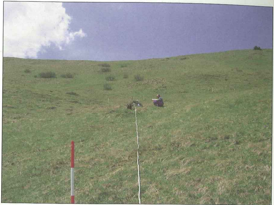
Abb. 2: Einmessen einer Referenzfläche in den Nockbergen, Ebene Reichenau.

Auf jeder Bergmahdfläche wurden ein bis drei Referenzflächen von 2 x 10 m für Pflanzenaufnahmen und ein zukünftiges Monitoring angelegt. Die Flächen wurden subjektiv in möglichst charakteristischen Bereichen der Wiese ausgewählt, eingenordet und georeferenziert (LIEB & JUNGMEIER 2006). Im Gelände wurden die Flächen mit Einmessungspunkten (Plastikplättchen auf Metallrohren) markiert. Die Verortung fand sowohl mit GPS als auch mit Maßband und Kompass statt. Später wurden die Daten in ein geografisches Informationssystem gebracht und mit Hilfe von Orthofotos korrigiert. Im GIS erstellte Karten sollen zusammen mit den GPS-Koordinaten die Auffindung der Referenz-