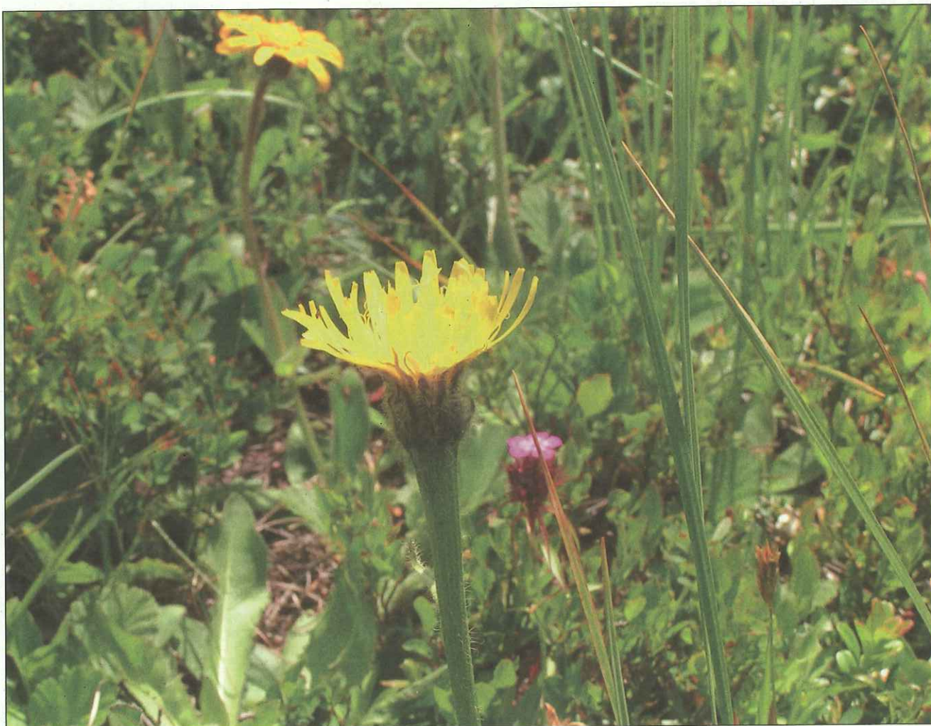
Abb. 5: Leitartenmonitoring entlang eines 2 x 50 m Transektes: Einblütiges Ferkelkraut ( Hypochoeris uniflora ).

Die Erhebung der Bewirtschaftungsweise erfolgte mittels Befragungsbo-