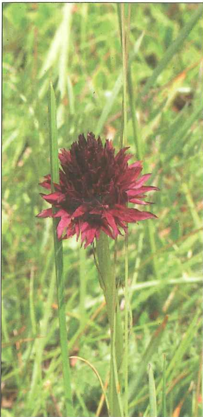
Abb. 6: Leitartenmonitoring entlang eines 2 x 50 m Transektes: Schwarzes Kohlröserl ( Nigritella nigra ).

gen. Sie dient der Einschätzung ob die Fläche überhaupt den Zertifizierungsrichtlinien für „Kärntner Almheu“ entspricht (siehe www.almheu.at ).