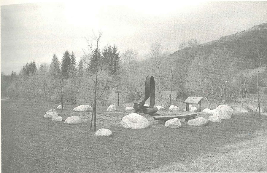
Rastplatz – Wassererlebnisweg Rattendorf im Gailtal: Anschauungsobjekte, die den BesucherInnen analoge Informationen verdeutlichen, können großes Staunen auslösen und prägen sich daher sehr gut in das menschliche Gedächtnis ein. Im vorliegenden Beispiel wird die verheerende Kraft von Hochwässern anhand eines „spektakulär deformierten“, eisernen Brückenelementes veranschaulicht.

führt. Letzteres hängt sehr oft mit besonderen Sehenswürdigkeiten zusammen, die oft nur sehr aufwändig erschlossen werden können (z.B. Schluchten).