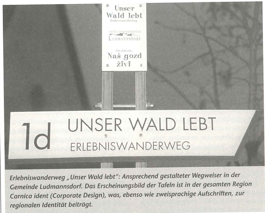
Erlebnisswanderweg „Unser Wald lebt“: Ansprechend gestalteter Wegweiser in der Gemeinde Ludmannsdorf. Das Erscheinungsbild der Tafeln ist in der gesamten Region Carnica ident (Corporate Design), was, ebenso wie zweisprachige Aufschriften, zur regionalen Identität beiträgt.